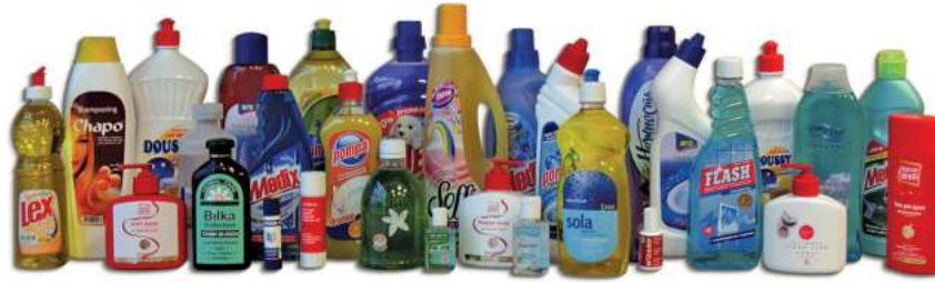
COSMETICS & HOUSEHOLD CHEMICALS