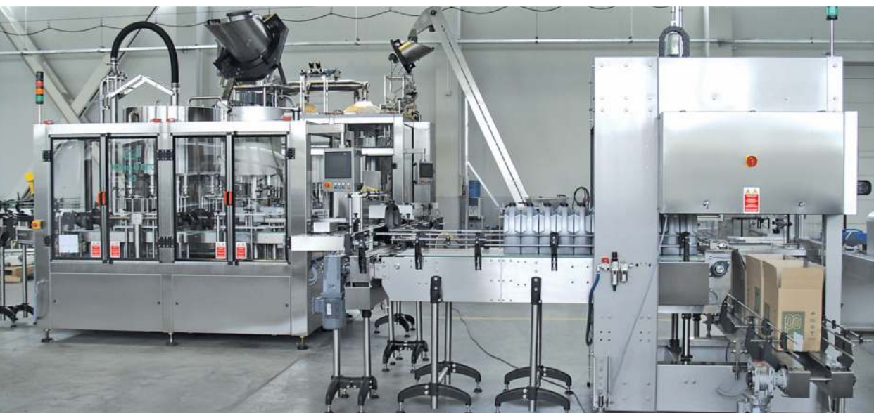
Complete bottling line for motor oil Pragmatic® / Комплексная линия розлива моторного масла Pragmatic®

Роторный моноблок Pragmatic 46 PO (Pressure overflow – избыточное давление) для розлива по уровню сильно пенящихся продуктов (охлаждающие жидкости, жидкости стеклоомывателя, моющие средства и др.)