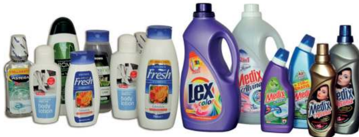
COSMETICS & HOUSEHOLD CHEMICALS